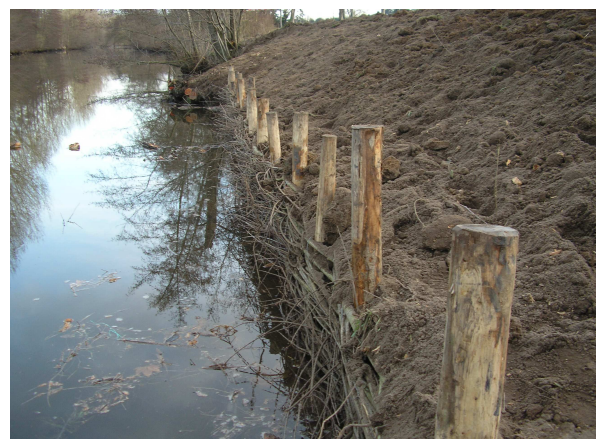
▲ Reprofilage et consolidation d'une berge par des végétaux Commune d'Airvault (79)

Une berge trop endommagée ou trop abrupte doit être réaménagée et reconsolidée avant toute replantation.