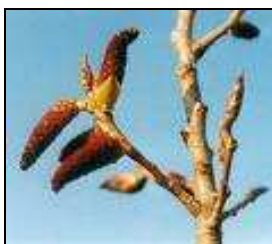
Chatons mâles de peuplier noir

A leur apparition, les chatons mâles sont gros, et de couleur rouge à pourpre. Les chatons femelles sont plus fins et le plus souvent vert clair.