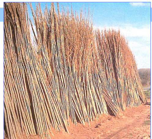
▲ la mise en jauge des plants est indispensable avant la plantation