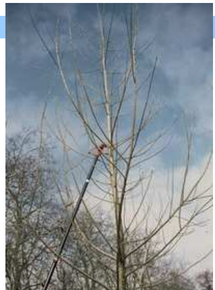
Les branches qui concurrencent l'axe principal seront enlevées lors de la taille