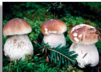
La cueillette des champignons peut être soumise à autorisation

Dans la première catégorie, on peut citer les fruits, fleurs, champignons et certaines plantes (branda). Leur « exploitation » peut s'effectuer dans un cadre familial ou de bon voisinage. Néanmoins, ils font souvent l'objet de « cueillettes sauvages », qui génèrent des conflits.