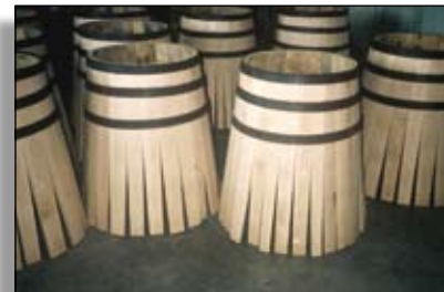
Le merrain demande des chênes de qualité

chêne : le chêne de qualité est toujours recherché par l'industrie. En revanche, les débouchés pour les produits de qualité charpente ou traverses sont relativement réduits en raison de la moindre utilisation de ces qualités dans la construction ou le transport.