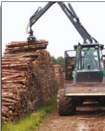
Bois de trituration provenant d'une éclaircie résineuse

Bois de trituration résineux : malgré la présence d'usines de transformation régionales (Châtelleraut pour la fabrication de panneaux de particules) ou proches (Facture, ...), ce débouché souffre de deux handicaps : la concurrence d'autres matières premières et les fluctuations mondiales des devises. Dans tous les cas, le bois de trituration est extrêmement peu rémunérateur.