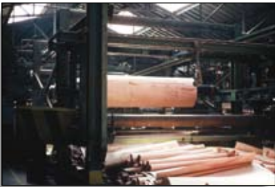
Déroulage pour la fabrication du contreplaqué

peuplier : la demande est soutenue puisque les industriels souffrent d'un manque de matière première, qui va s'intensifier dans les 10 ans qui vont suivre la tempête de 1999. Le principal débouché pour les peupliers est l'industrie du déroulage qui nécessite des billes d'au moins 30 cm de diamètre au fin bout. En revanche, la transformation du peuplier en petits sciages, pour la réalisation de caisses ou palettes, ne se porte pas bien en raison de la concurrence des matières plastiques.