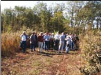
Groupe de propriétaires en formation de terrain