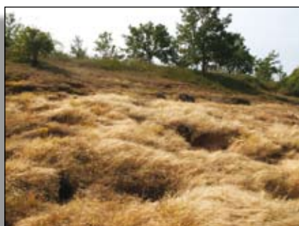
Pelouse composée de Vulpie à longue soie

Ces pelouses rases se développent sur des terrains calcaires, en pente plus ou moins accentuée, orientés au sud. Elles constituent l'un des biotopes les plus riches et les plus diversifiés de notre région.