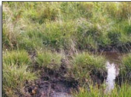
Les tourbières évoluent lentement

Basiques ou plus fréquemment acides, les tourbières sont formées par la très lente décomposition de la matière organique, en situation de température basse, de milieu humide, stagnant, donc pauvre en oxygène, avec une alimentation en eau provenant essentiellement des précipitations. Le milieu est pauvre en minéraux. La végétation de base est composée de sphaignes, à croissance continue vers le haut, qui sont à l'origine de la formation séculaire de la tourbe.