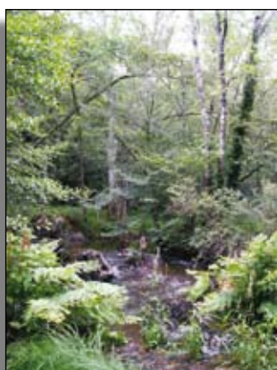
La forêt épure les eaux

Le second enjeu prioritaire est l'approvisionnement en eau potable dans une région où la qualité de la ressource est fortement dégradée, la forêt jouant un rôle majeur pour la qualité des eaux des bassins d'alimentation des captages.