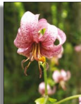
Le Lys martagon est une espèce protégée

Les zones dites de « biodiversité remarquable » sont constituées des territoires du réseau NATURA 2000, des périmètres d'inventaires (zones naturelles d'intérêt écologique, faunistique et floristique) et des zones réglementées (arrêtés préfectoraux de protection de biotope, réserves et sites).