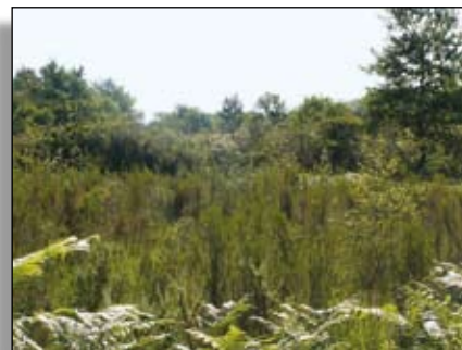
La Bruyère à balais est aussi appelée brande

Les phytosociologues en distinguent deux grands types en région :