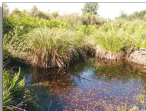
Les mares tendent naturellement à se combler

Lieux de vie de multiples espèces, les mares , points d'eau de petite surface, peuvent être considérées comme des habitats transitoires, dont l'évolution naturelle est le boisement par enrichissement et végétalisation. C'est pourquoi il est essentiel d'empêcher leur comblement en les entretenant. Si elles sont absentes, il est important d'en créer. Elles constituent des points d'abreuvement indispensables pour toute la faune sauvage. Espèces patrimoniales : amphibiens et reptiles, odonates (libellules).